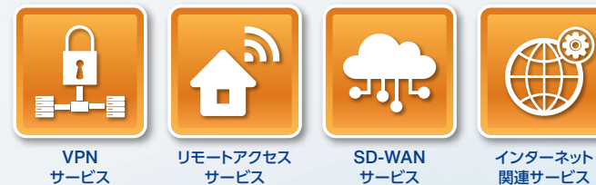
VPNサービス リモートアクセスサービス SD-WANサービス インターネット関連サービス