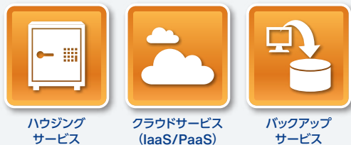
ハウジングサービス クラウドサービス (IaaS/PaaS) バックアップサービス